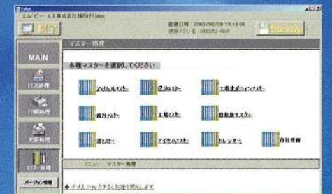
各種マスターの登録と修正処理