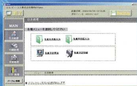
生産予定データ作成・照会・変更処理