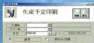
生産予定表の印刷処理

生産日程を自動で棒グラフに変換し、表示・印刷します。また、印刷条件指定で「枠のみ」を選べば、日付と枠のみの手入力用予定表が印刷できます。