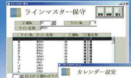
各種マスターの登録と修正処理