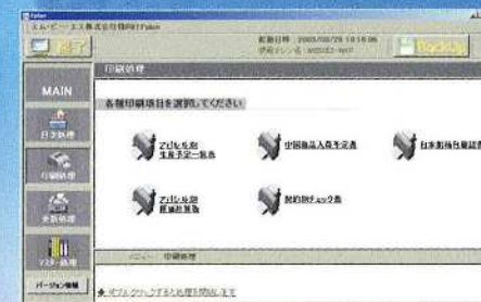
各印刷物の発行と、生産予定データの修正処理

原価計算表・入荷予定表等を印刷します。また、各データ確認画面でデータ修正が行えます。