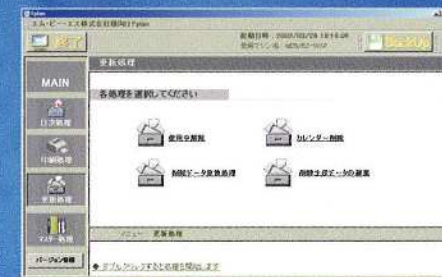
システムデータの更新